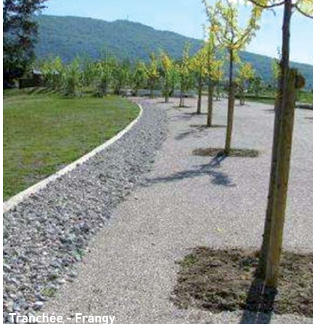
Tranchée - Frangy

Maintenir le fonctionnement hydraulique de la tranchée : Entretien le revêtement drainant de surface. Ramasser les déchets ou les feuilles mortes qui obstruent les regards.